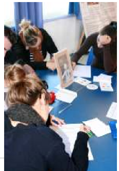
Les participants remplissent la feuille d'évaluation

Analyse et échange collectif autour de la journée, qui se termine par remise du livret La Démocratie : « Comment ça marche ? » et la distribution d'un questionnaire d'évaluation à chaque participant.