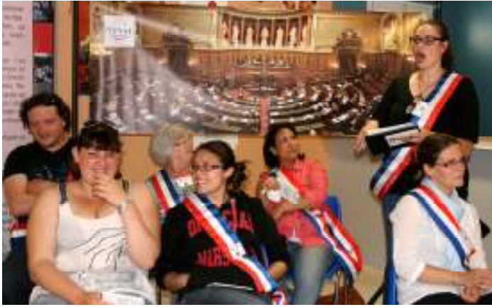
Une sénatrice défend la proposition de loi